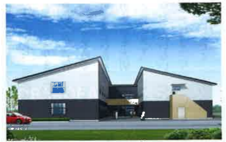
住宅型有料老人ホーム 伍 [3月OPEN] 前橋市公田町604-1 TEL 027-226-6155